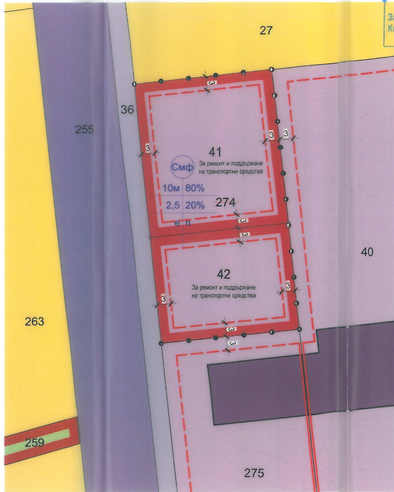
ПЛАН ЗА ЗАСТРОЯВАНЕ М 1 : 500