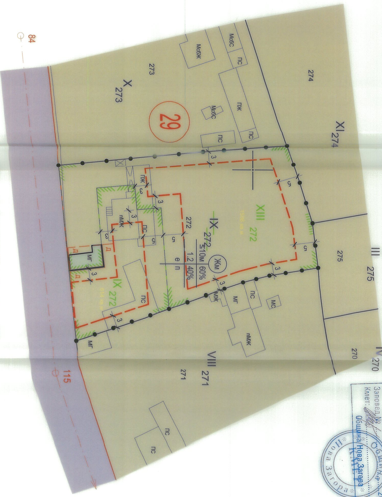
ПЛАН ЗА ЗАСТРОЯВАНЕ M 1 : 500